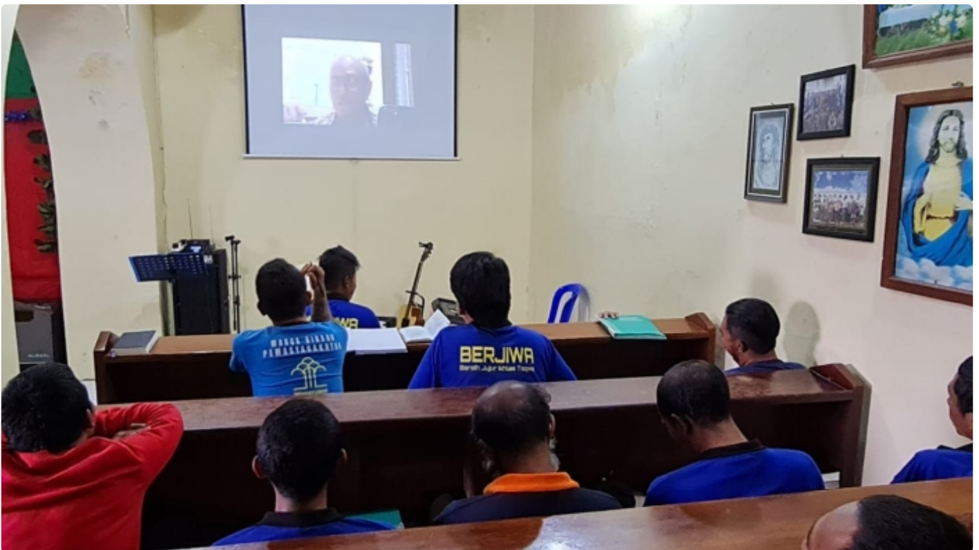
Kegiatan Ibadah WBP Umat Kristiani Lapas Ambarawa secara On Line

SEMARANG - Warga Binaan Pemasyarakatan (WBP) Lembaga Pemasyarakatan (Lapas) Ambarawa Mengikuti kegiatan ibadah virtual integrasi Lapas/Rutan se Indonesia, Rabu (02/11/2022).